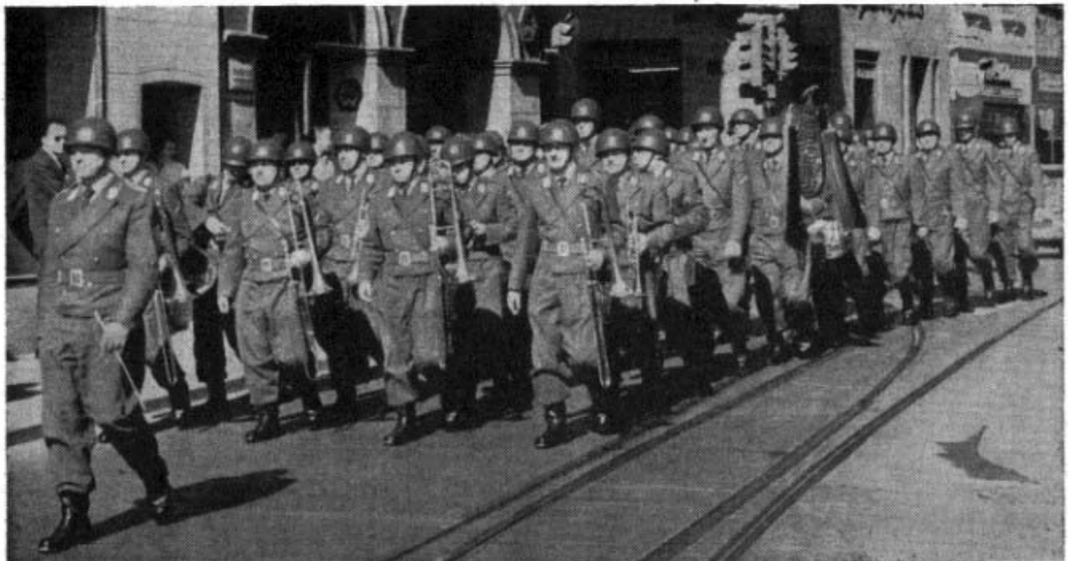
Musikkorps 5 der Bundeswehr, Standort Koblenz